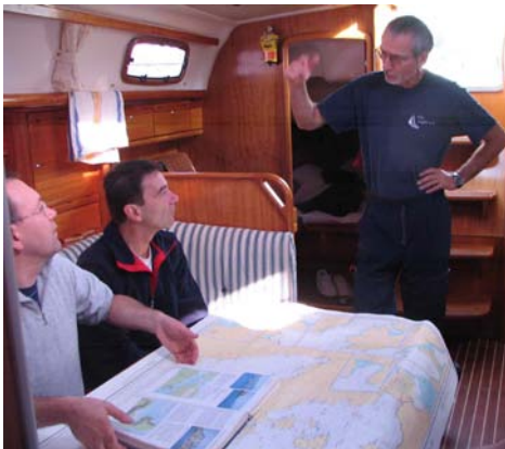
Gemeinsame Tagesplanung: Wohin fahren wir heute?