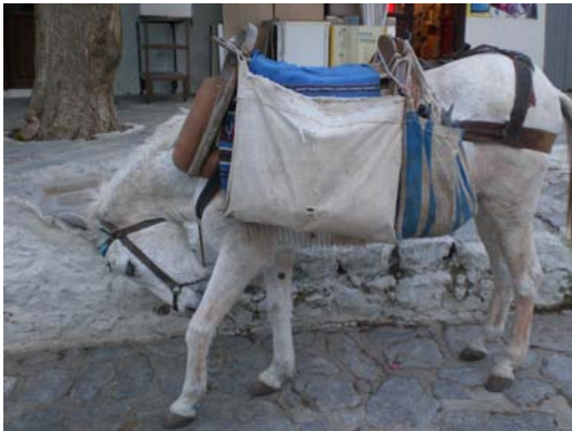
Taxi bitte! (Hydra)