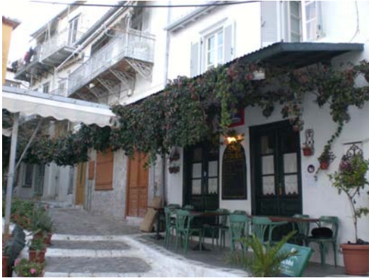
Taverne in Aigina