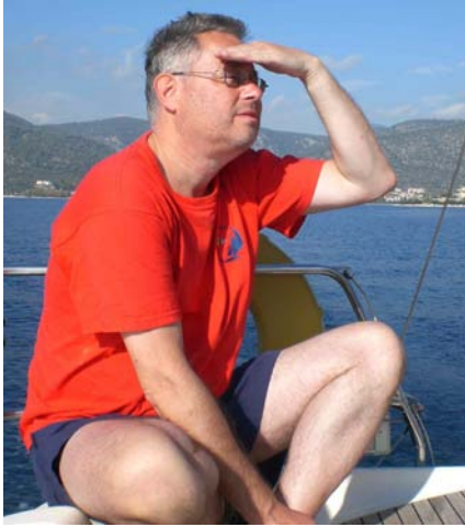
Norbert: Wo ist der Wind?