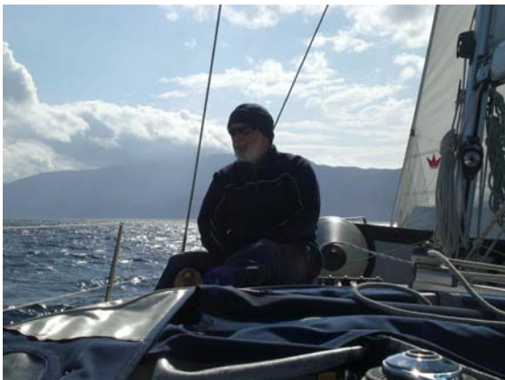
Co-Skipper Lupo meditiert über seine Zukunft in der Ägäis