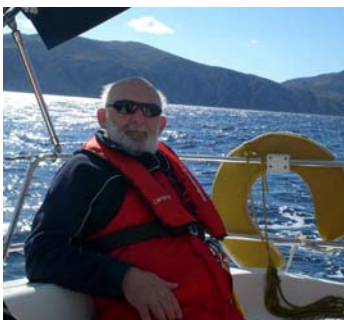
„Und irgendwann bleib i dann do, ...“ (STS)