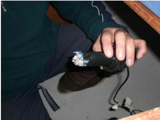
Unsere Logge, bevor ihr Lupo zu Leibe rückte