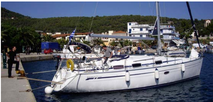
Die „Stelios Blue“, eine Bavaria 37 Cruiser mit echten Renn-Eigenschaften (max. Speed auf unserem Törn: 9,1 kn FdW!)