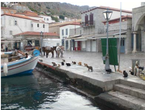
Hydra, auch die Stadt der 1000 Katzen