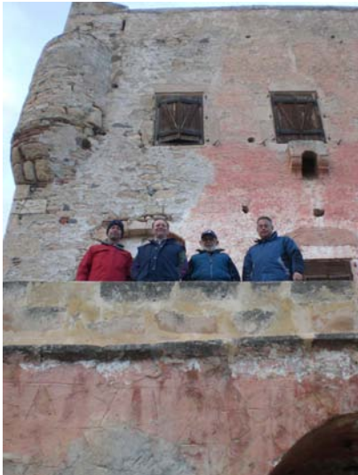
Vier Seebären auf dem alten Stadtturm von Aigina